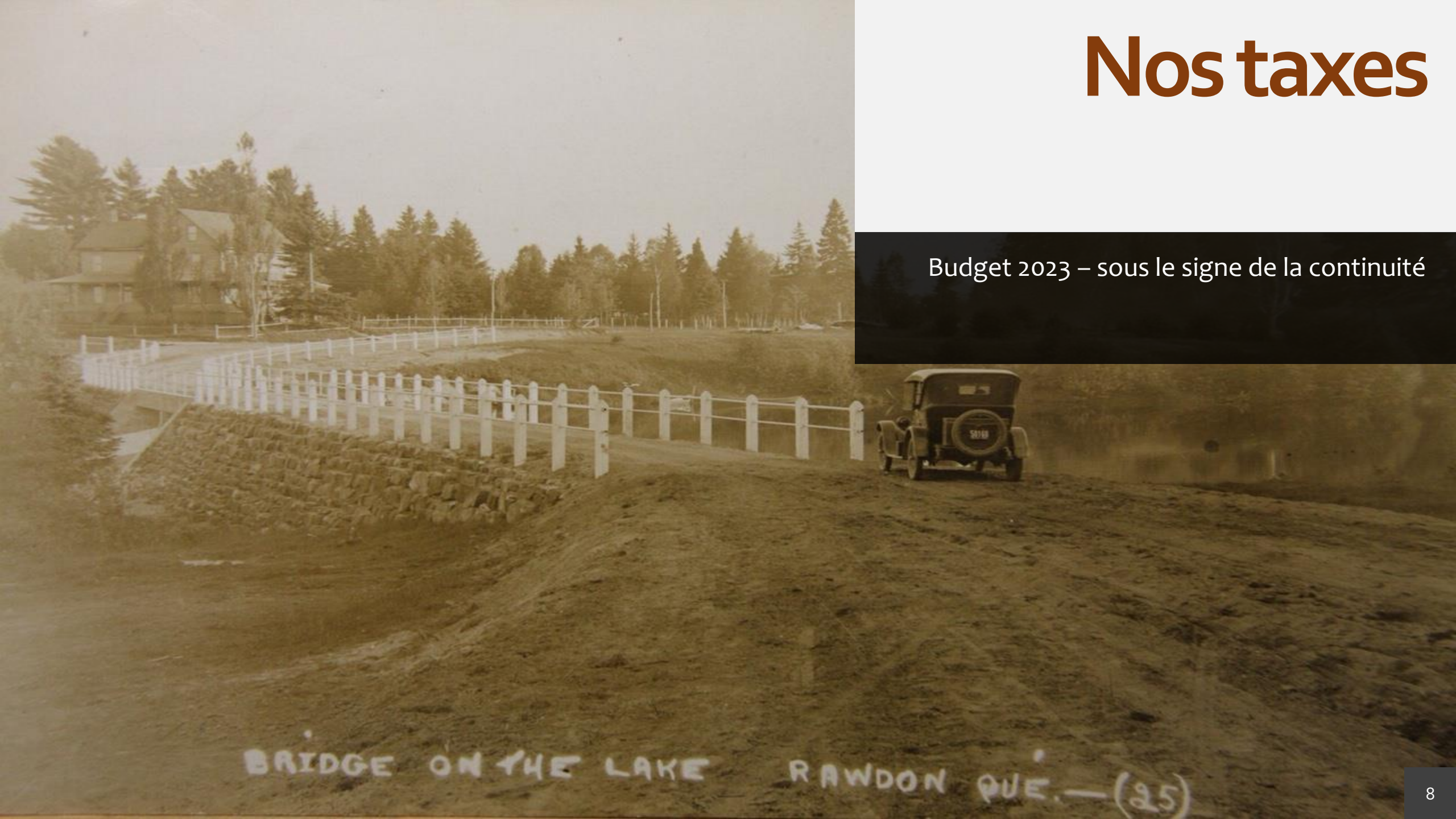
BRIDGE ON THE LAKE RAWDON QUE. — (25)

Budget 2023 – sous le signe de la continuité